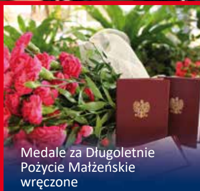
Medale za Długoletnie Pożycie Małżeńskie wręczone