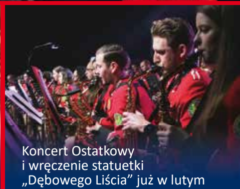
Koncert Ostatkowy i wręczenie statuetki „Dębowego Liścia” już w lutym

Bezpłatny miesięcznik mieszkańców gminy Suchy Las Biedrusko • Chludowo • Gołęczewo • Jelonek • Osiedle Grzybowe • Suchy Las Suchy Las Wschód • Zielątkowo • Złotkowo • Złotniki Osiedle • Złotniki Wieś