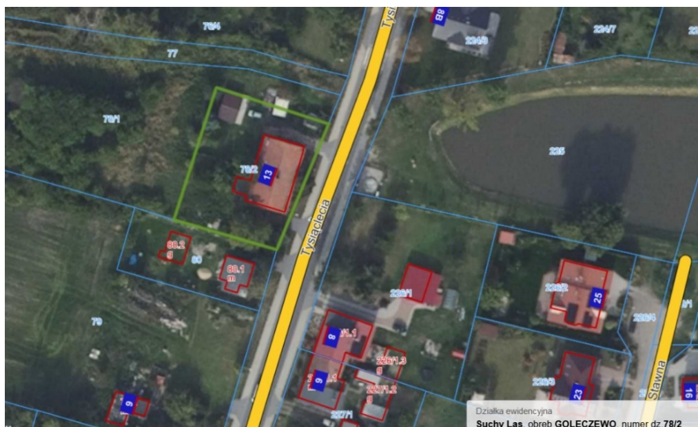
Mapa nr 2 (suchylas.e-mapa.net), kolorem zielonym zaznaczono granice działki nr 78/2