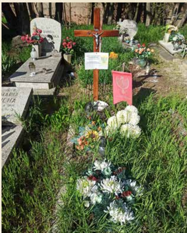
◀ GRÓB FRANCISZKA MAGDZIAKA