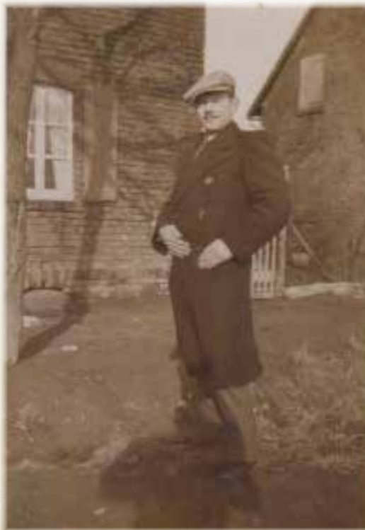
BRONISŁAW SOŁTYSIAK

W aktach Gminnego Koła ZBoWiD w Suchym Lesie zachowało się jego imię i nazwisko oraz fotografia. Brak innych danych.