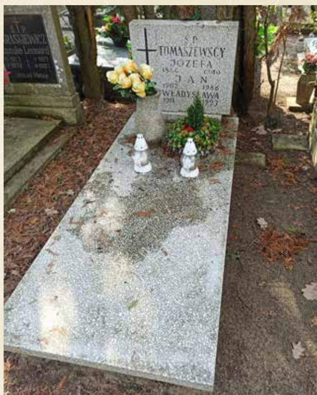
◀ GRÓB JÓZEFA TOMASZEWSKIEGO