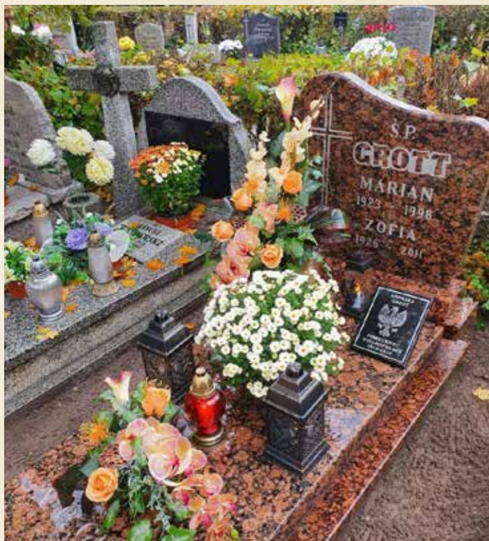
GROTT ANDRZEJ