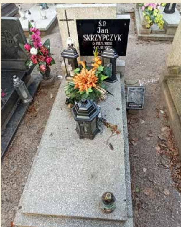
JAN SKRZYPCZYK Fotografia z nagrobka