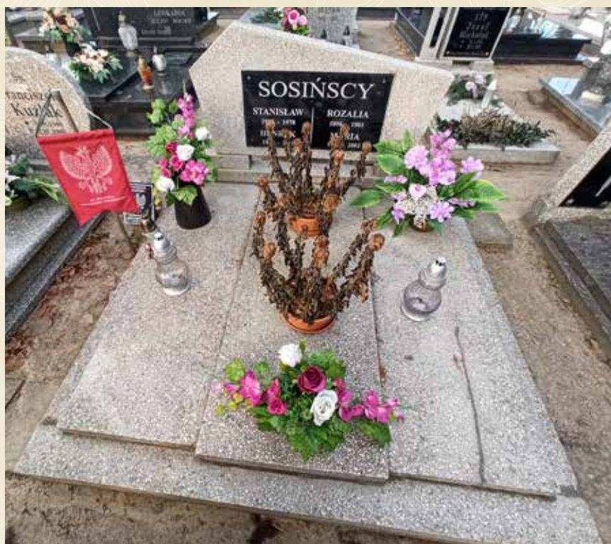
◀ GRÓB STANISŁAWA SOSIŃSKIEGO

Urodził się 13 kwietnia 1900 roku, a zmarł 4 lutego 1978 roku w Suchym Lesie. Był uczestnikiem Powstania Wielkopolskiego, ale nie udało się ustalić, gdzie walczył. Spoczywa na cmentarzu parafialnym w Morasku.