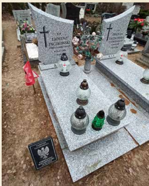
◀ GRÓB TADEUSZA PACZKOWSKIEGO

Na podstawie informacji WTG „Gniazdo” umieszczonych na stronie powstancy-wielkopolscy.pl. Zob. też na sip.geopoz.pl/data/cmentarze/cmentarze.php oraz w: R. Chruszczewski, Mieszkańcy gminy Suchy Las i okolic w powstaniu wielkopolskim, Wydawnictwo eMPi 2 , Poznań 2016.