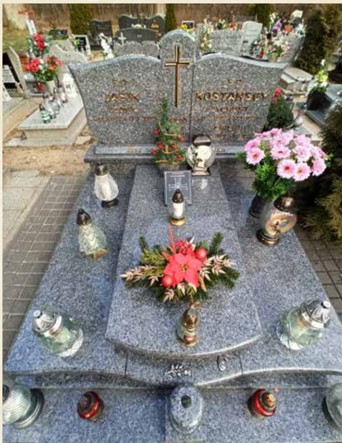
KOSTANSKI ZYGMUNT