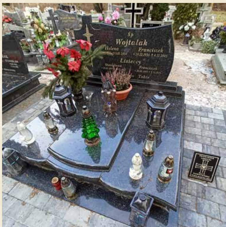
LISIECKI FRANCISZEK