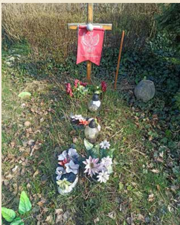
◀ GRÓB ALEKSANDRA SOWIŃSKIEGO