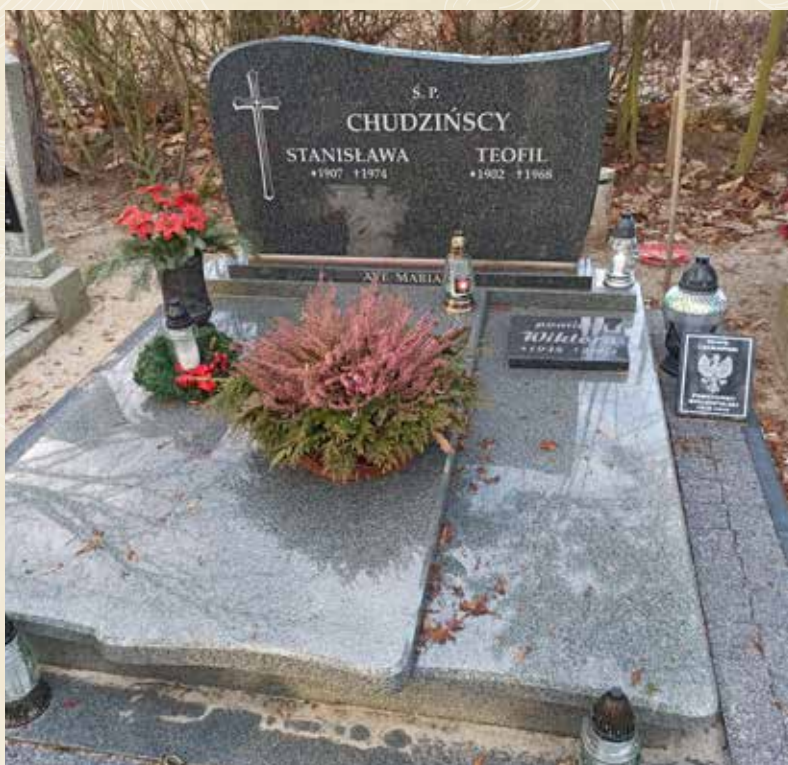
TEOFIL CHUDZIŃSKI