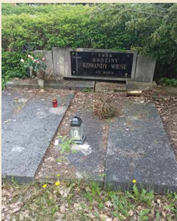
◀ GRÓB FRANCISZKA WIESE

Spoczywa na cmentarzu junikowskim w Poznaniu.