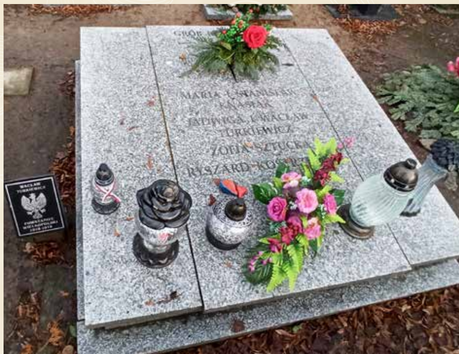
TURKIEWICZ WACŁAW