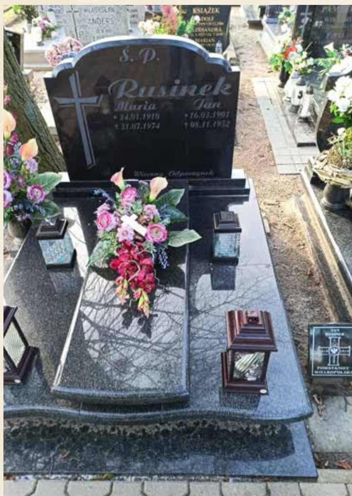
◀ GRÓB JANA RUSINKA

Urodził się 16 marca 1901, a zmarł 8 listopada 1952 roku. Nie udało się ustalić, gdzie walczył. Pochowany został na cmentarzu w Chludowie.