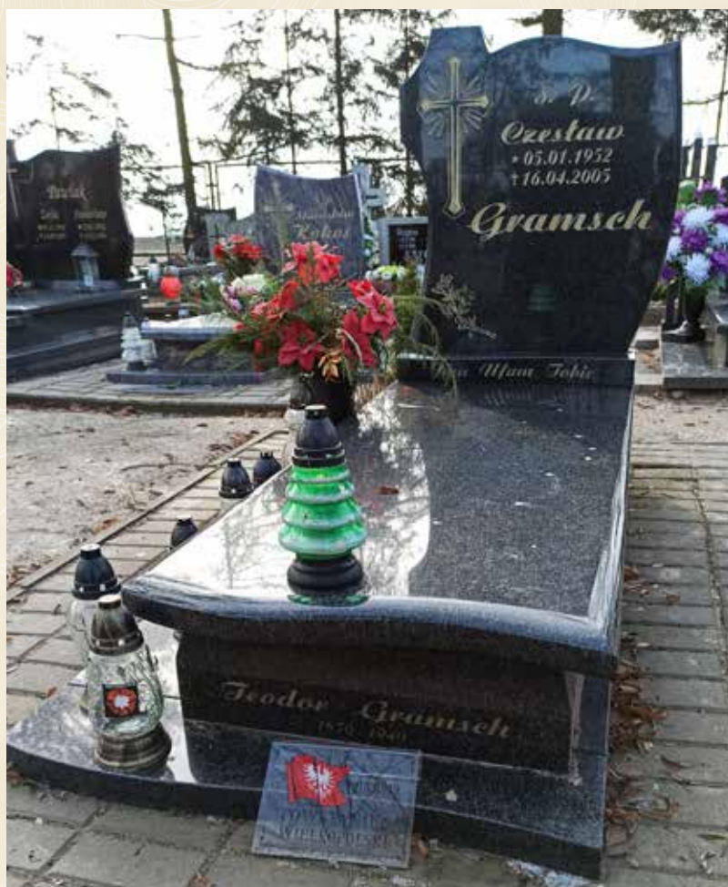
◀ GRÓB TEODORA GRAMSCHA