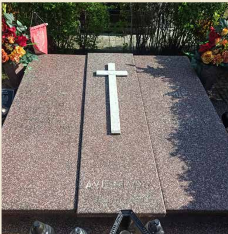
◀ GRÓB JAKUBA WIECHEĆ

Zob. też na sip.geopoz.pl/data/cmentarze/cmentarze.php oraz w: R. Chruszczewski, Mieszkańcy gminy Suchy Las i okolic w powstaniu wielkopolskim , Wydawnictwo eMPI 2 , Poznań 2016.