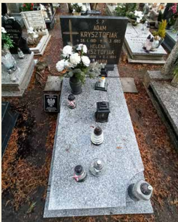
KRYSZTOFIAK ADAM