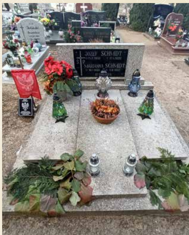
◀ GRÓB JÓZEFA SCHMIDTA

Urodził się 15 lutego 1900 roku. W Powstaniu Wielkopolskim walczył pod Osieczną. Zmarł 11 kwietnia 1989 roku i spoczywa na cmentarzu parafialnym w Morasku.