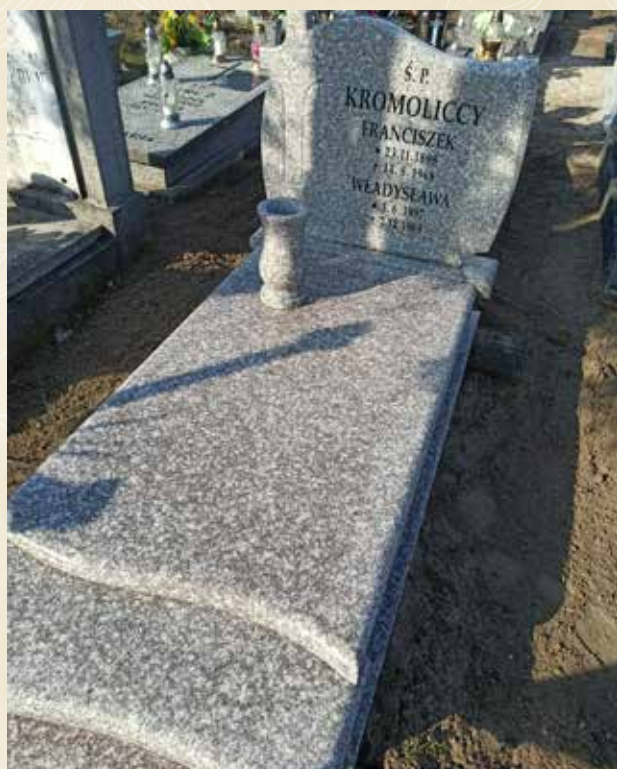
◀ GRÓB FRANCISZKA KROMOLICKIEGO

Zmarł 14 sierpnia 1898 roku i spoczywa na cmentarzu junikowskim w Poznaniu.