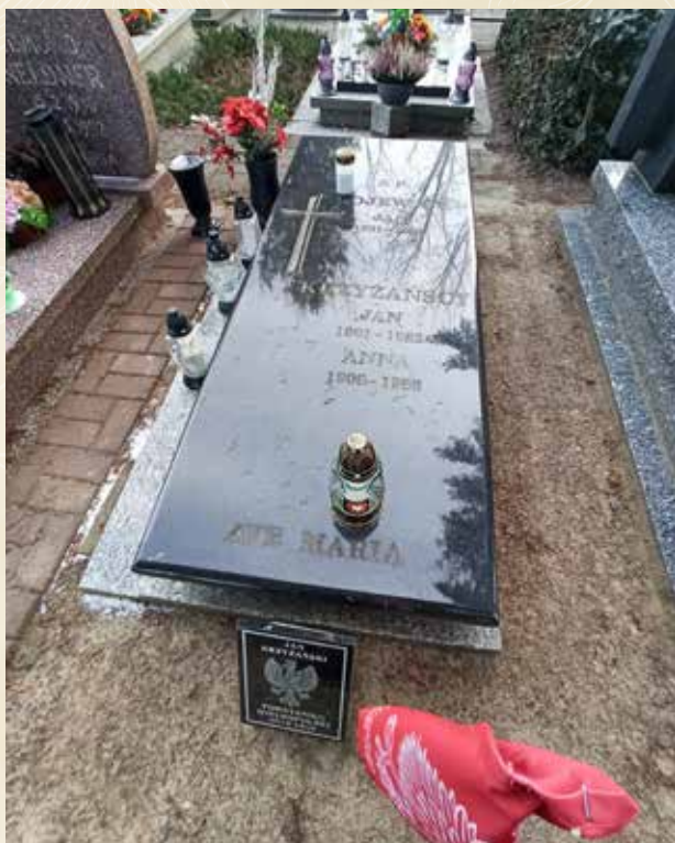
◀ GRÓB JANA KRZYŻAŃSKIEGO ▲

Na podstawie materiałów archiwalnych Koła ZBoWiD w Suchym Lesie. Akt zgonu USC Suchy Las nr 11/1982. Zobacz też na liście osób odznaczonych Wielkopolskim Krzyżem Powstańczym na stronie powstancy-wielkopolscy.pl Zob. też w: R. Chruszczewski, Mieszkańcy gminy Suchy Las i okolic w powstaniu wielkopolskim , Wydawnictwo eMPI 2 , Poznań 2016.