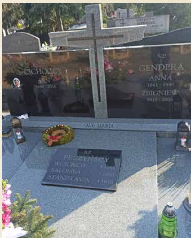
◀ GRÓB WOJCIECHA PIECZYŃSKIEGO