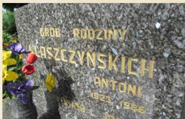
◀ GRÓB JANA KLASZCZYŃSKIEGO