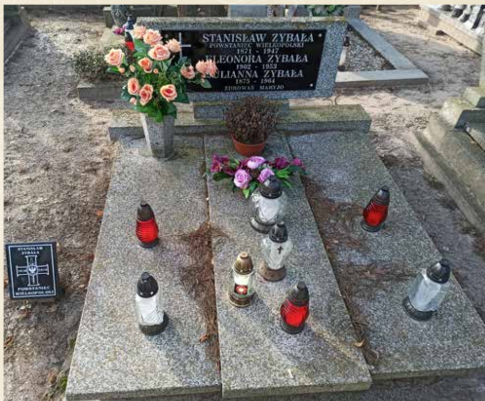
◀ GRÓB STANISŁAWA ZYBAŁY