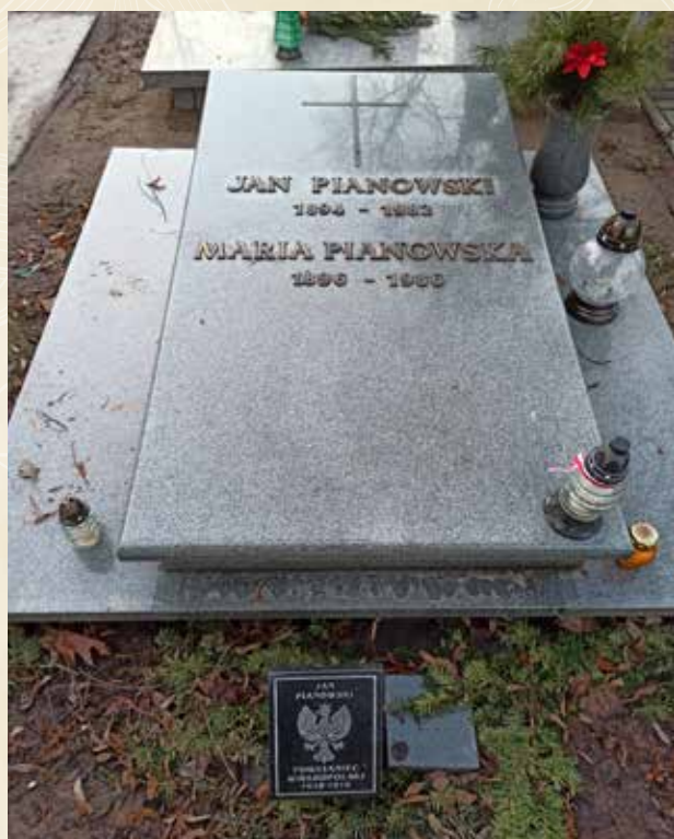
PIANOWSKI JAN