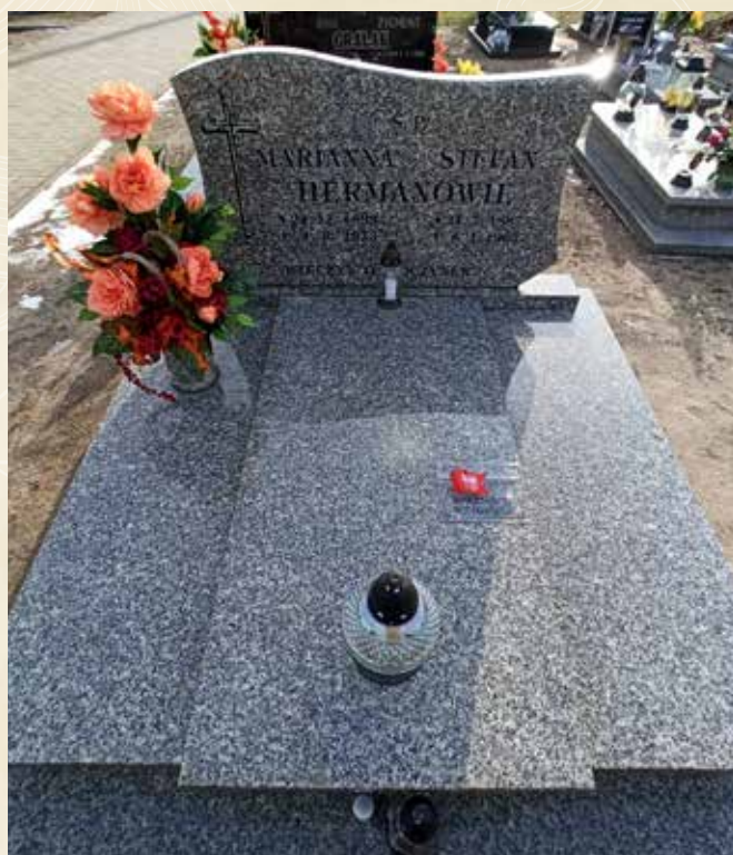
◀ GRÓB STEFANA HERMANA

Urodził się 31 lipca 1883 roku w miejscowości Chrusty, powiat szamotulski. Był mieszkańcem Zielątkowa. W Powstaniu Wielkopolskim walczył od 2 stycznia do 4 kwietnia 1919 roku w kompanii ludomsko-obornickiej. W 1936 roku był członkiem Związku Powstańców Wielkopolskich, Koło Chłudowo. Uchwałą Rady Państwa nr 0/1048 z dnia 17 grudnia 1958 roku odznaczony został Wielkopolskim Krzyżem Powstańczym. Zmarł 8 stycznia 1963 roku i spoczywa na cmentarzu parafialnym w Żydowie.