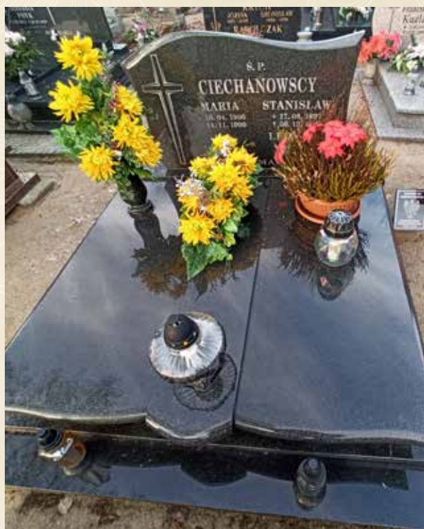
CIECHANOWSKI STANISŁAW