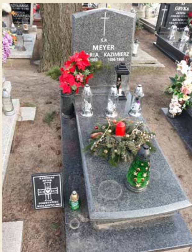
◀ GRÓB KAZIMIERZA MEYERA

Urodził się 23 listopada 1896 roku w Promnicach, powiat poznański. W czasie Powstania Wielkopolskiego brał czynny udział w zajmowaniu obozu ćwiczebnego Biedrusko. Uchwałą Rady Państwa nr 0/2 z dnia 9 stycznia 1960 roku odznaczony został Wielkopolskim Krzyżem Powstańcym. Zmarł w 1969 roku i spoczywa na cmentarzu parafialnym w Owińskach.