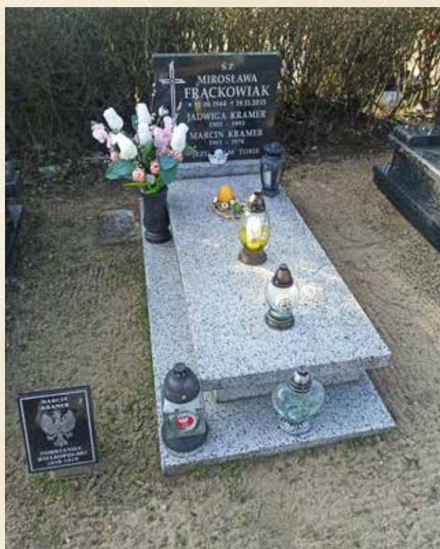
◀ GRÓB MARCINA KRAMERA