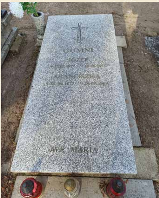
◀ GRÓB JÓZEFA GUMNEGO