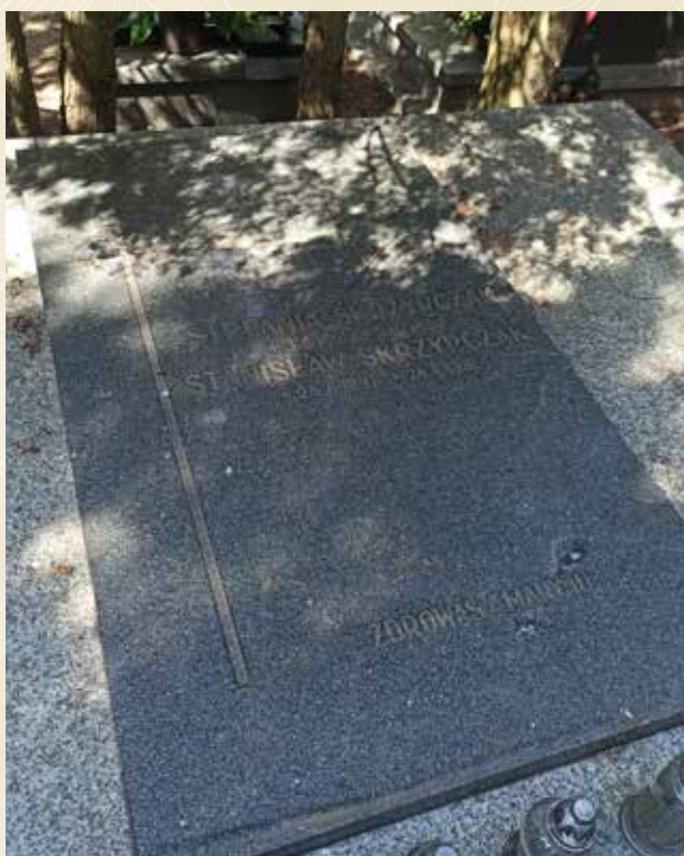
◀ GRÓB STANISŁAWA SKRZYPCZAKA

Na podstawie informacji WTG „Gniazdo” umieszczonych na stronie powstancy-wielkopolscy.pl . Zob. też na sip.geopoz.pl/data/cmentarze/cmentarze.php .