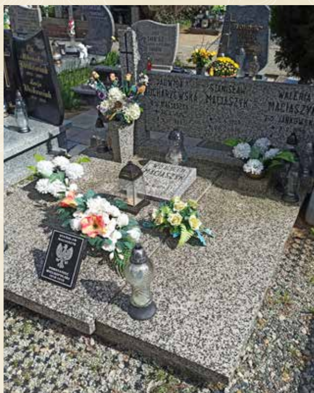
◀ GRÓB STANISŁAWA MACIASZYKA

Na podstawie informacji WTG „Gniazdo” umieszczonych na stronie powstancy-wielkopolscy.pl. Zob. też w: R. Chruszczewski, Mieszkańcy gminy Suchy Las i okolic w powstaniu wielkopolskim , Wydawnictwo eMPi 2 , Poznań 2016.