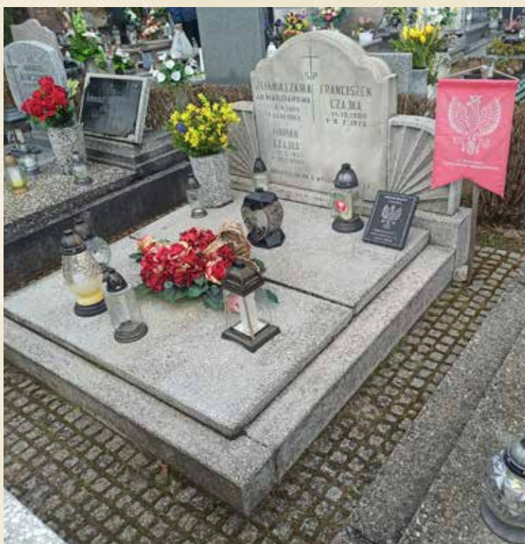
◀ GRÓB FRANCISZKA CZAJKI