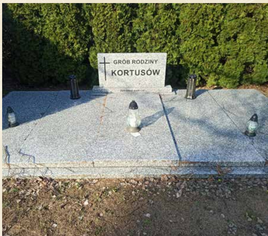
◀ GRÓB RODZINY KORTUSÓW, w którym prawdopodobnie spoczywa Stanisław Kortus