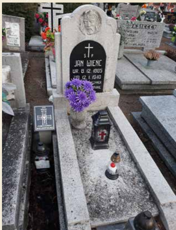
◀ GRÓB JANA WIENĆCIA

Urodził się 8 grudnia 1885 roku w Morasku, powiat poznański. W Powstaniu Wielkopolskim miał stopień szeregowca. Nie udało się ustalić gdzie walczył. Z zawodu był stolarzem i mieszkał w Owińskach. Zmarł 12 stycznia 1940 roku i spoczywa na cmentarzu parafialnym w Owińskach.