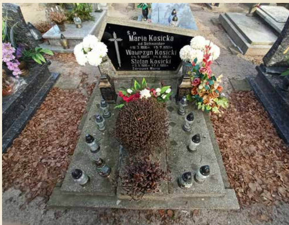
◀ GRÓB WAWRZYNA KOSICKIEGO

Urodził się 29 lipca 1895 roku w Poznaniu, a zmarł 6 czerwca 1968 roku w Chludowie, gdzie został pochowany. Był uczestnikiem Powstania Wielkopolskiego, ale nie udało się dotąd potwierdzić, gdzie walczył.