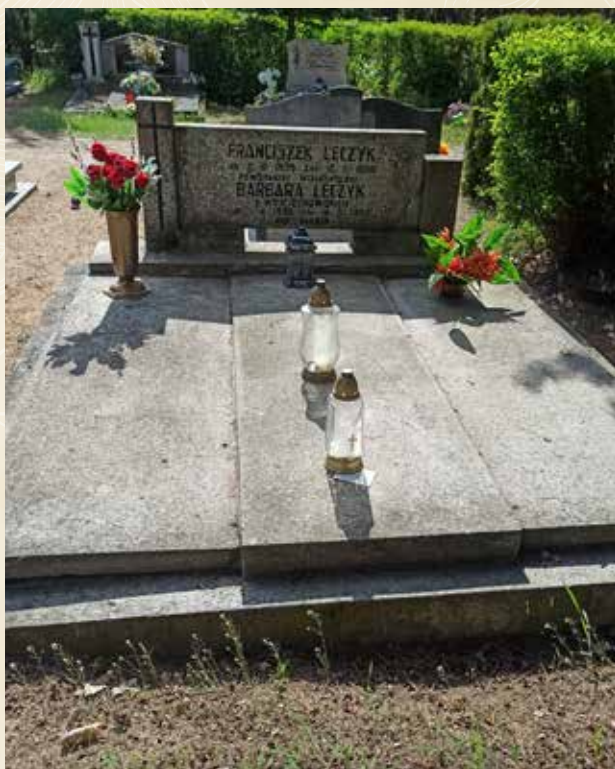
◀ GRÓB FRANCISZKA LECZYKA

Zmarł 12 lipca 1980 roku i spoczywa na cmentarzu junikowskim w Poznaniu.