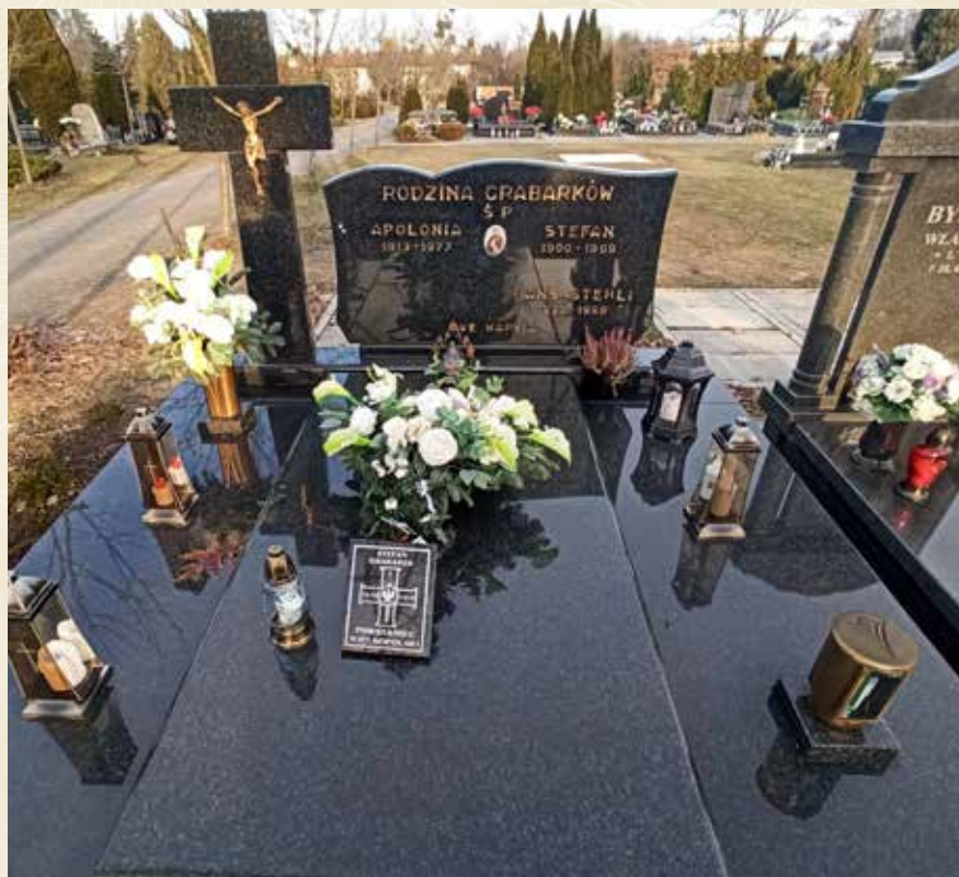
Fotografia z nagrobka Stefana Grabarka