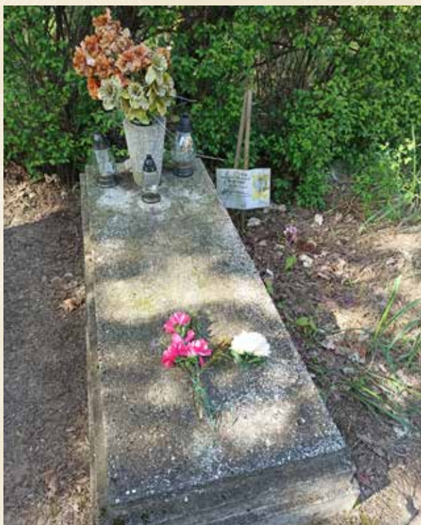
◀ GRÓB JANA KRAMERA

Na podstawie informacji WTG „Gniazdo” umieszczonych na stronie powstancy- -wielkopolscy.pl Zob. też w: R. Chruszczewski, Mieszkańcy gminy Suchy Las i okolic w powstaniu wielkopolskim , Wydawnictwo eMPI 2 , Poznań 2016.