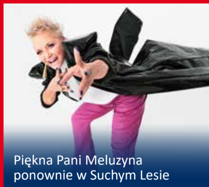
Piękna Pani Meluzyna ponownie w Suchym Lesie