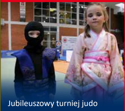
Jubileuszowy turniej judo