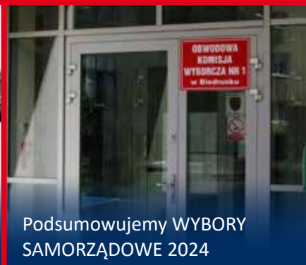
Podsumowujemy WYBORY SAMORZĄDOWE 2024