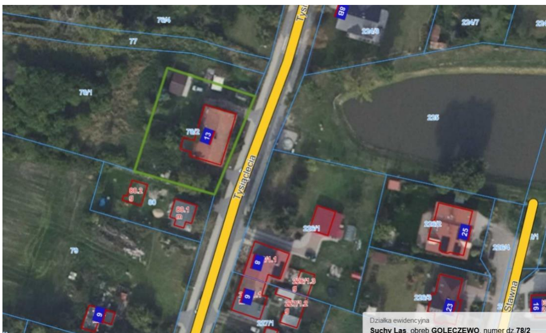
Mapa nr 2 (suchylas.e-mapa.net), kolorem zielonym zaznaczono granice działki nr 78/2