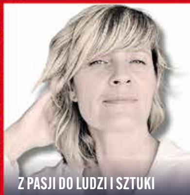
Z PASJI DO LUDZI I SZTUKI