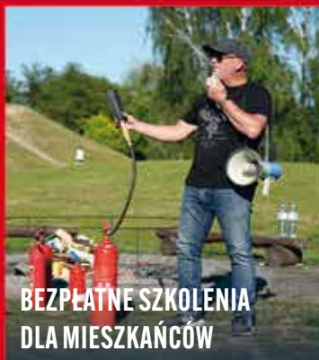
BEZPŁATNE SZKOLENIA DLA MIESZKAŃCÓW