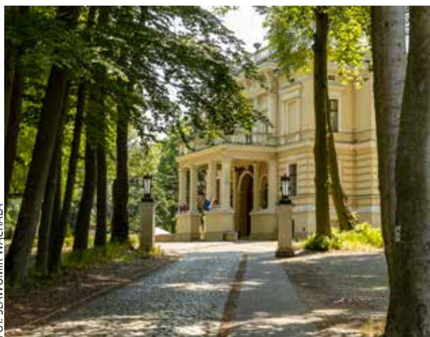
FOT. SŁAWOMIR WACHAŁA