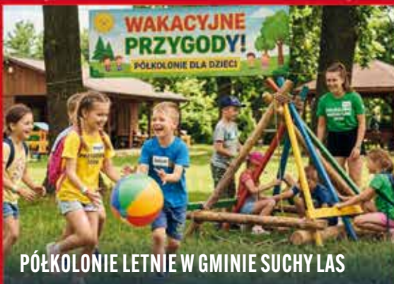
PÓŁKOLONIE LETNIE W GMINIE SUCHY LAS